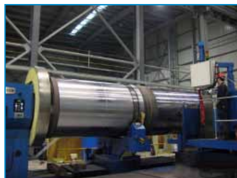
数控车床（ \phi 3.15 米）

主轴直径： \phi 200 毫米 行程： X=20米 Y=6米 Z=1.2米 W=1.2米