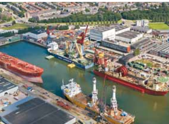
豪氏威马工厂（荷兰）