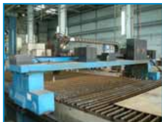
数控等离子切割机