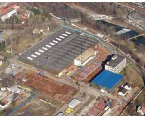
豪氏威马工厂（捷克共和国）